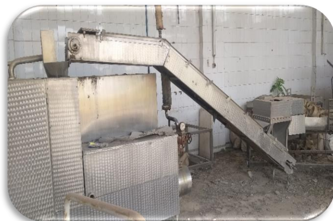
وضعیت ماشین آلات و تجهیزات داخل کارخانه