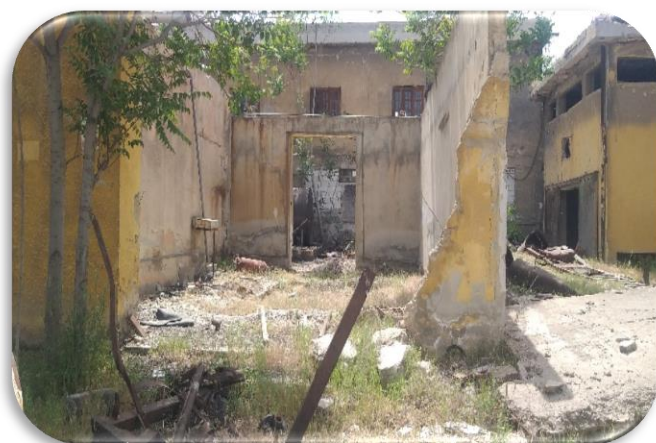
وضعیت بیرونی ساختمان کارخانه