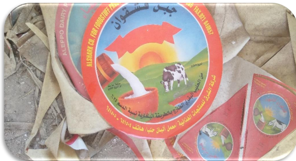
محصولات کارخانه قبلی